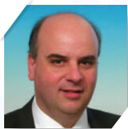
Απόστολος Παπαλιός, Διευθυντής, Ερευνητικού, Εκπαιδευτικού και Πειραματικού Κέντρου ELPEN Επισκέπτης Καθηγητής, Ιατρικής Σχολής Harvard Ad. Av. Καθηγητής, Ιατρικής Σχολής Ευρωπαϊκού Πανεπιστημίου Κύπρου Αναπληρωτής Πρόεδρος Εθνικής Επιτροπής Πειραματικής Έρευνας